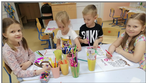
Раскраски к 9 мая вечером после сна.