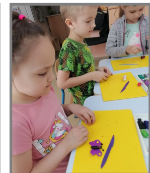
Ребята на занятиях. Срисовывание полевых цветов и лепка насекомых.