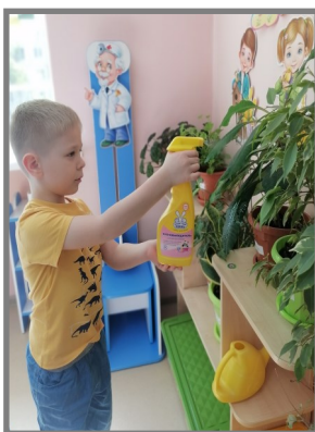
Трудовые поручения: полив и опрыскивание цветов утром и подметание пола после ужина.