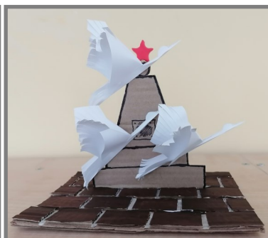
Софья З с поделкой к 9 мая