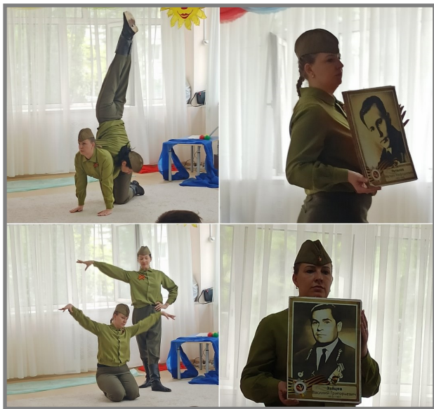
Праздничное театрализованное мероприятие «Салют Победе»

Раскраски, открытки, поделки, приготовленные детьми на занятиях.