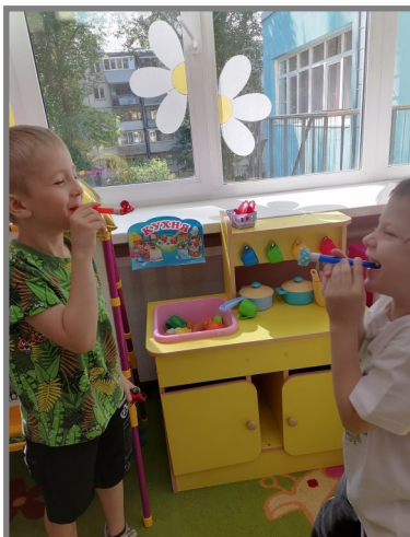
Индивидуальная работа. Дыхательная гимнастика.

Ветры, бури, ураганы, Дуйте, что есть мочи. Вихри, вьюги и бураны, Разыграйтесь к ночи! В облаках трубите громко, Вейтесь над землёю. Пусть бежит в полях позёмка Белую змею!