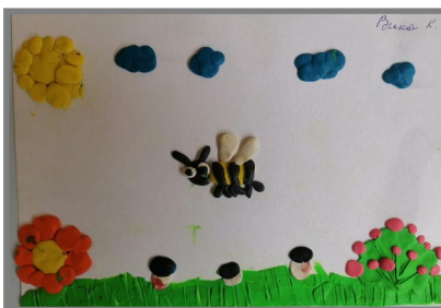
Вика К. Пластилинография 20 мая Всемирный день пчел.