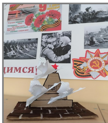
Поделка Софьи З. к празднику Победы.

Я желаю всем на свете Мира, счастья и тепла. Без войны, под мирным небом, Чтобы жили мы всегда!