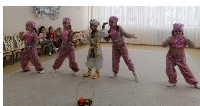
Репетиция на музыке