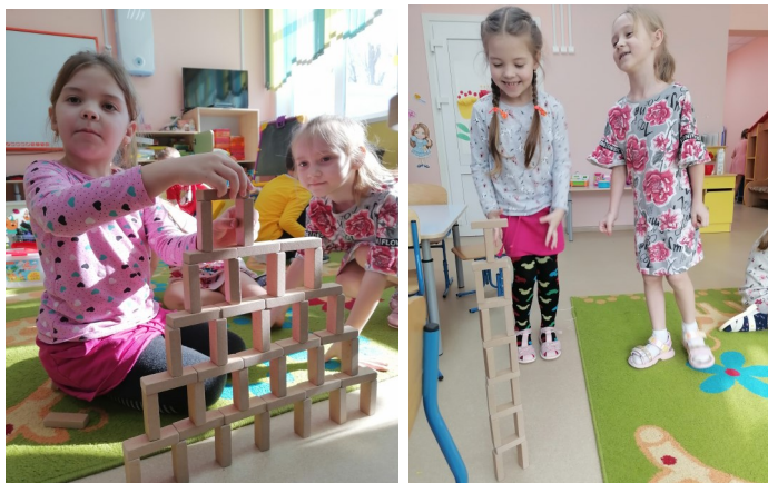
Летаем на самолете (сюжетно-ролевая игра).

Мы покоряем разные высоты. Сегодня мы строим высокую башню. Играем « У кого выше».